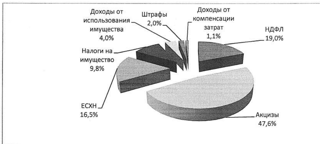
Рис.1. Структура собственных доходов бюджета Привольненского сельского поселения за I квартал 2026 года

Структура собственных доходов бюджета Привольненского сельского поселения за I квартал 2026 года представлена на рис. 1.